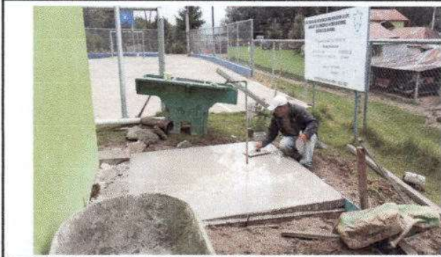
Foto1: Fundición de base de pila