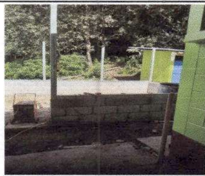
Foto 4: Realización de muro de lamina troquelada por lamina lisa.